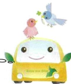
エコドライブキャラクター 「エコ丸クン」