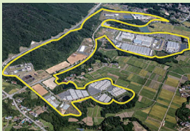
相馬中核工業団地