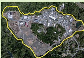
いわき四倉中核工業団地