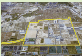
双葉町中野地区復興産業拠点