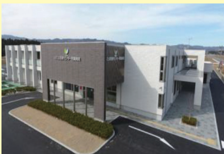
ふたば医療センター附属病院