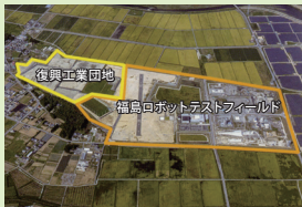
南相馬市復興工業団地