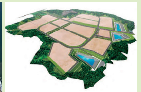
浪江町南産業団地