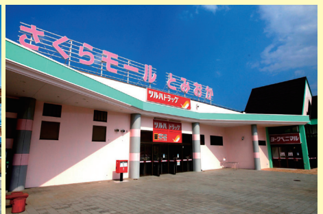
さくらモールとみおか