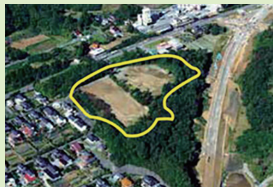
駒ヶ嶺工業用地 (新地町)