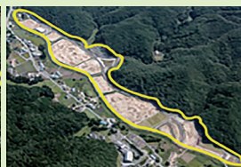
田ノ入工業団地 (川内村)