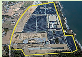
浪江町棚塩産業団地